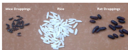
Excretas de Ratón