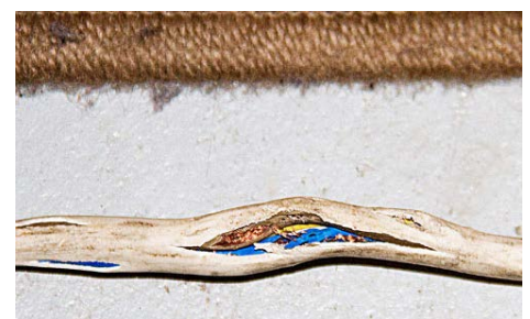
Frayed cords can cause electrical shock or could start a fire.