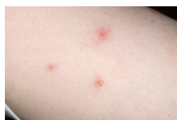
Piquetes de Chinche