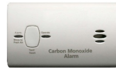
Carbon Monoxide Alarm