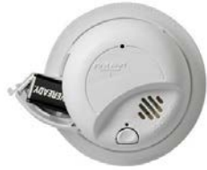
Detector de Humo