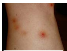
Mordida de Cucaracha