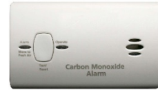
Alarma de Monóxido de Carbono