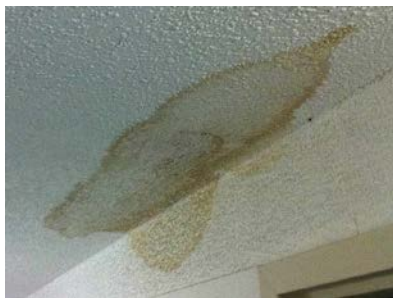
Watch out for water damage- this could mean you have a leak