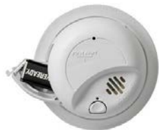
Detector de Humo