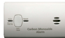
Alarma de Monóxido de Carbono