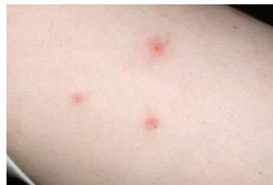
Piquetes de Chinche