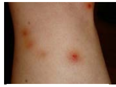
Mordida de Cucaracha